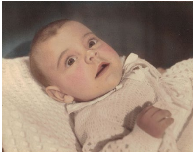
Figuur 7: My babafoto

Ek is op 21 Maart 1954 gebore toe my ma bykans 40 en my pa 63 jaar oud was.