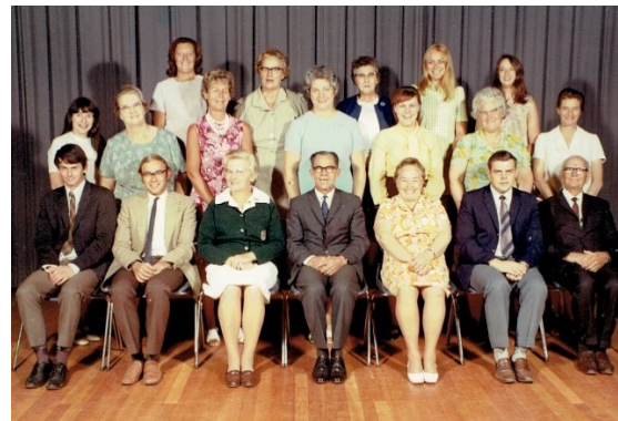
Figuur 4: Brixton Primary School – 1971 (Pa Tom sittend voor heel regs)

Volgens die artikel het sy onderwysloopbaan in die Laingsburgdistrik met 'n tydelike aanstelling by 'n tweemanskooltjie begin. Sy laaste onderwyspos was weer 'n tydelike aanstelling by Brixton Primary School in Johannesburg. Op 79 jarige ouderdom was hy "die man met die langste onderwysloopbaan in die Transvaal".