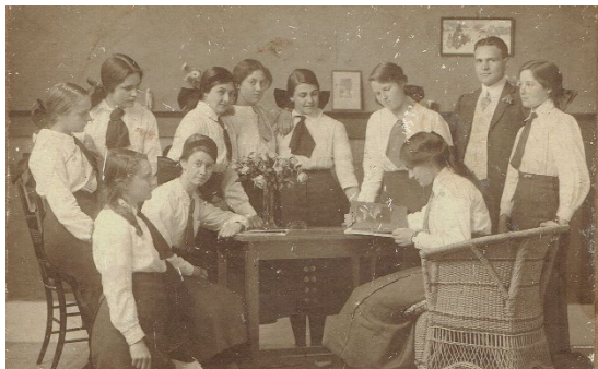
Figuur 3: Student Teachers

Hy het sy onderwyserseksamen in Desember 1910 daar afgelê. "Daardie dae was daar nog nie so iets soos onderwysdiplomas soos vandag nie. Daar in die Kaap was dit eintlik maar net Wellington wat toe 'n inrigting gehad het vir die opleiding van onderwysers. Die meeste van ons was maar 'student teachers' (wat) ons